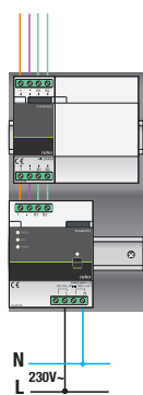
Schéma de câblage